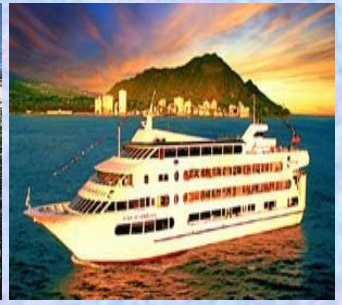
ディナークルーズ(イメージ)