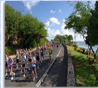
マラソン(イメージ)

約9万㎡もの広大な敷地に、ラグーンやスーパーブル、多彩なショップやレストラン、人気のスパなど、ありとあらゆるお楽しみが揃ったスーパーリゾート