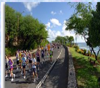
マラソン(イメージ)

約9万㎡もの広大な敷地に、ラグーンやスーパープール、多彩なショップやレストラン、人気のスパなど、ありとあらゆるお楽しみが揃ったスーパーリゾート