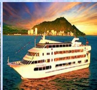
ディナークルーズ(イメージ)