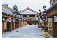
おかげ横丁 江戸時代から明治の伊勢の代表的な建築物を移築・再現。風情あふれる十層肉店などが軒を並べる。