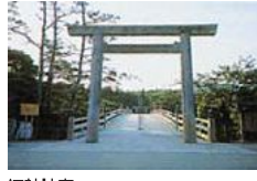
伊勢神宮 20年ごとの「式年遷宮」（平成25年）を前に学藝地区では「お水遣行事」（平成5年）など数々の行事が予定されています。