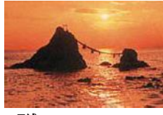
二見浦 緑帯を眺む人々で賑わう、大小の島が並んだ夫婦岩。夕日に輝く浮き臼が印象的。