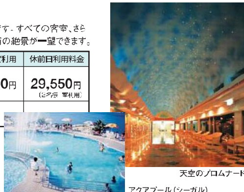
天空のフロムナード アクアプール(シーガル)