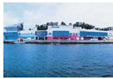
鳥羽水族館 人気のラッパやジゴロンをはじめ、約250種以上の動物が見学できるビッグスクールの水族館。