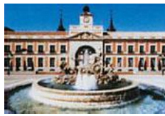
志摩スペイン村 海と人々の熱い、人と自然の調和をテーマに、人気者のラッパやジゴロンをはじめ、約250種以上の動物が見学できるビッグスクールの水族館。