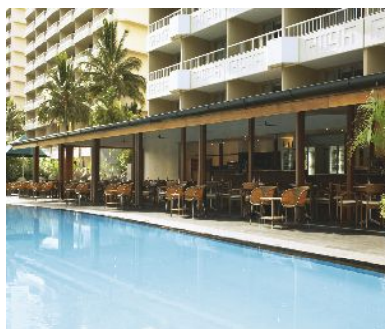
リーフ・ビュー・ホテル