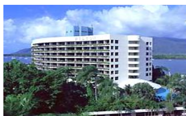
ヒルトンケアンズ