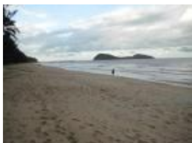
パームコーブ:イメージ

パームコーブ:朝食1回3,000円 ケアンズ:朝食1回4,000円 *お一人1回の料金