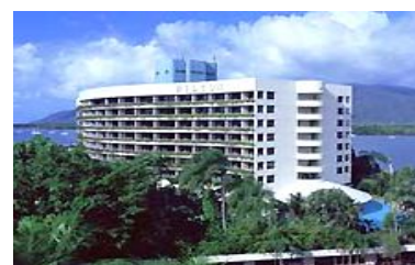
ヒルトンケアンズ