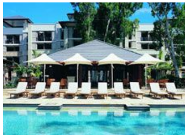
シーテンブルリゾート