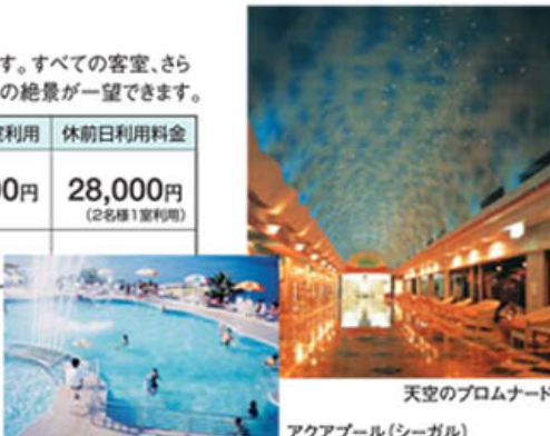
天空のプロムナード アクアプール(シーガル)

■夕食は料亭個室となります。 朝食はレストラン(バイキング)となります。 ※上記代金は大人一名あたりの代金です。 ※サービス料は含まれています。 ※消費税は別途必要となります。 ※入浴税お一人様150円が別途必要となります。