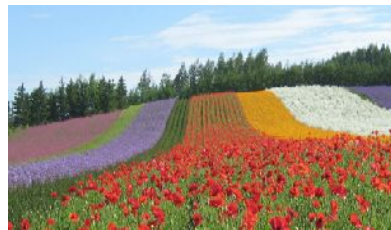
▲北海道 夏の風景(イメージ)