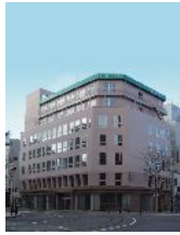
▲スキノグリーンホテル2 外観