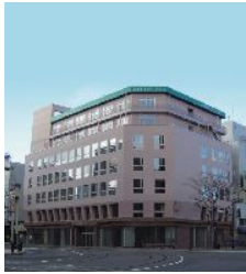
▲ススキノグリーンホテル2 外観