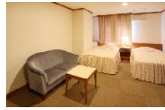
▲客室一例 洋室(1〜3名1室)