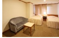
▲客室一例 洋室(1～3名1室)