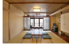
▲客室一例 和室(4名1室)