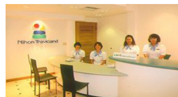
当社ツアーラウンジ(イメージ)

旅行企画・実施 (株)日本トラベランド 観光庁長官登録 旅行業732号 大阪支店: 〒542-0086 大阪府大阪市中央区西心斎橋2-4-2 難波日興ビル8階 予約事務センター: 〒430-0933 静岡県浜松市中区鍛冶町2-11